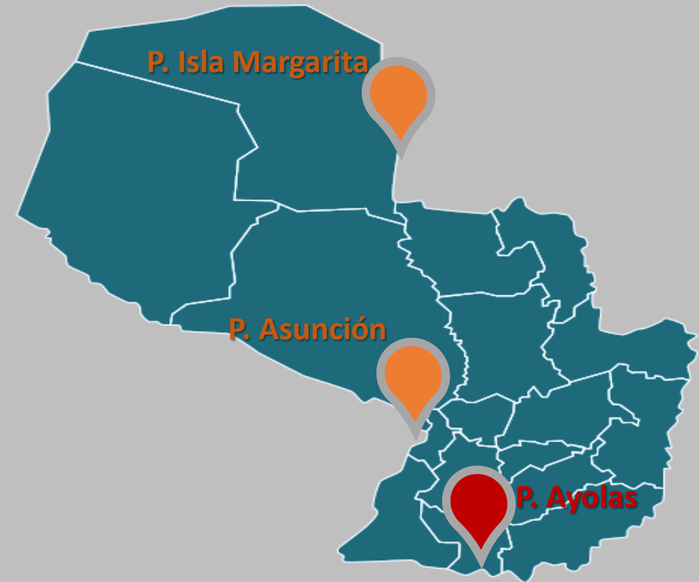
Valores mínimos históricos del nivel del río Paraguay en el Puerto de Asunción en los meses de mayo

Entiéndase que al hablar de mínimo histórico hacemos mención al valor mas bajo registrado en el mes, en este caso mayo.