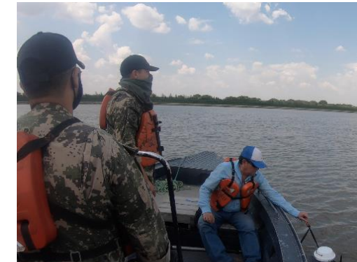
Realización de las mediciones con el apoyo de la Prefectura Naval de Alberdi.