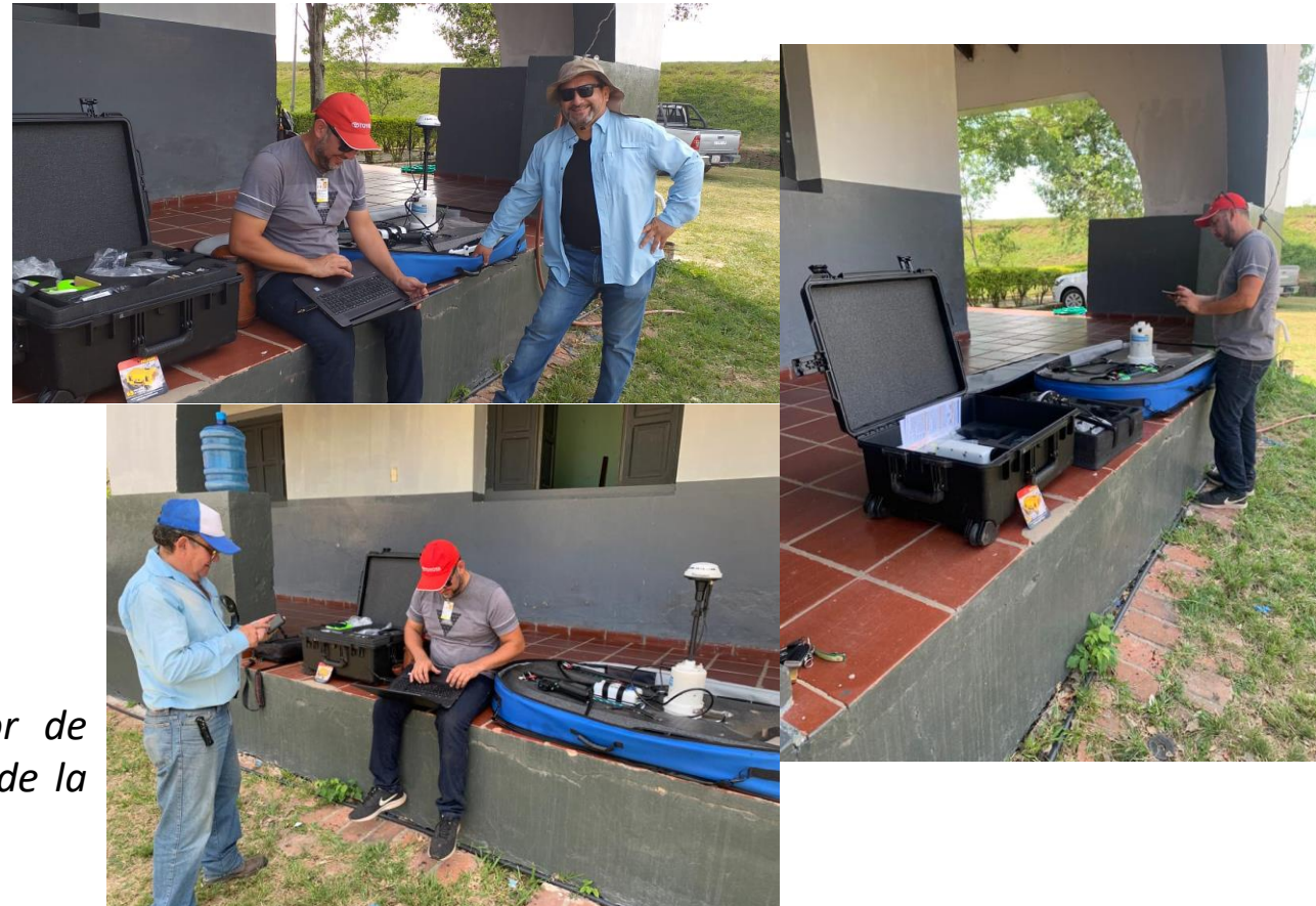
Preparando el equipo RiverSurveyor de Sotek, por parte del equipo técnico de la DMH.