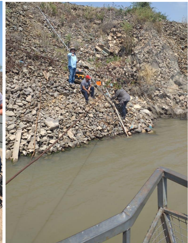
Imagen de la estación hidrometeorológica de Alberdi y prolongación del caño para el sensor de nivel.