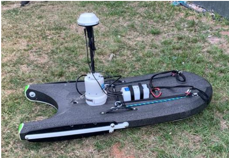
Equipo RiverSurveyor de Sotek, listo para la medición.

Gracias al apoyo de la Prefectura naval de Alberdi, se realizó el Aforo con el RiverSurveyor de SonTek, robusto de alta precisión y de fácil manejo; se basa en el principio físico del Efecto Doppler Acústico. Diseñado para medir caudal, velocidad, profundidad, temperatura, entre otros parámetros.