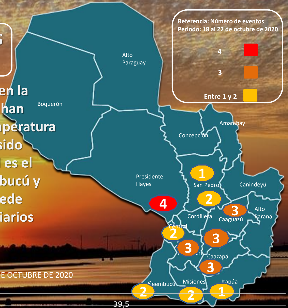
GRÁFICO DE RÉCORDS DIARIOS REGISTRADOS DESDE EL 18 AL 22 DE OCTUBRE DE 2020

Las jornadas de intenso calor continúan en la región y desde, el 18 al 22 de octubre se han registrado nuevos récords diarios de temperatura máxima en el país, algunas de ellas han sido superadas después de 48 años(1972), tal es el caso de las localidades de Pilar en Ñeembucú y Encarnación en Itapúa. En el mapa se puede apreciar la cantidad de nuevos récords diarios registrados por localidad en el periodo considerado.