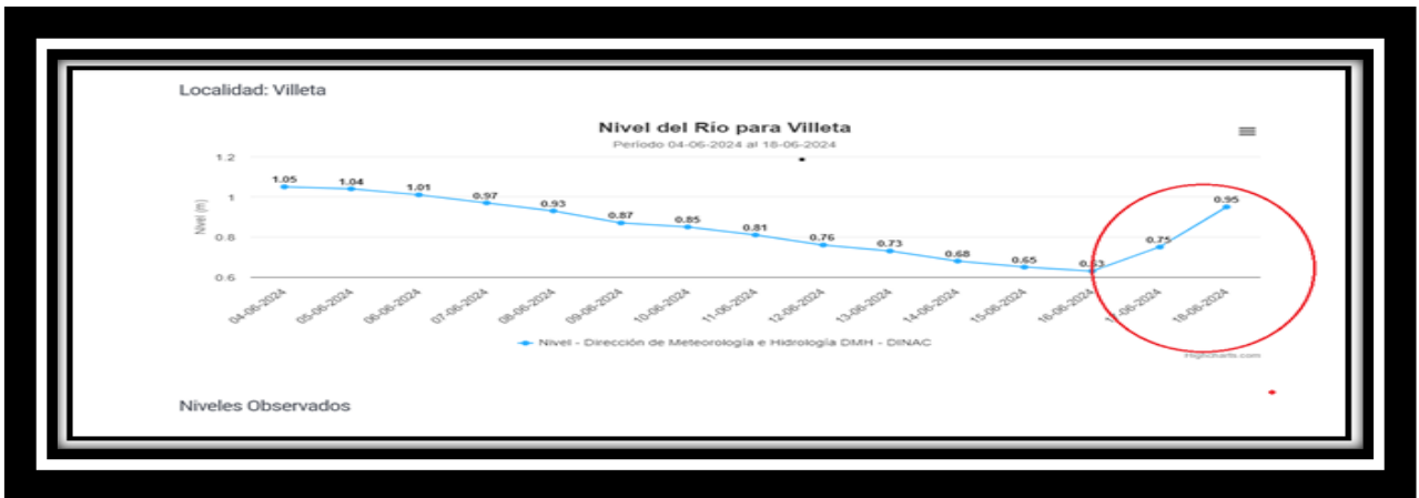
Figura 2. Niveles del río Paraguay. Estación de Villeta.