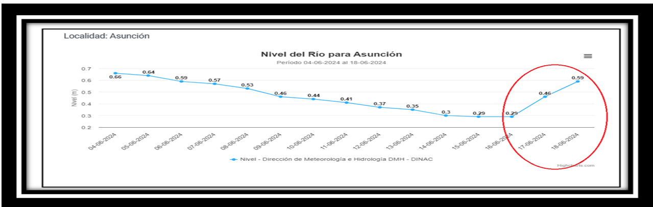
Figura 3. Niveles del río Paraguay. Estación de Asunción.